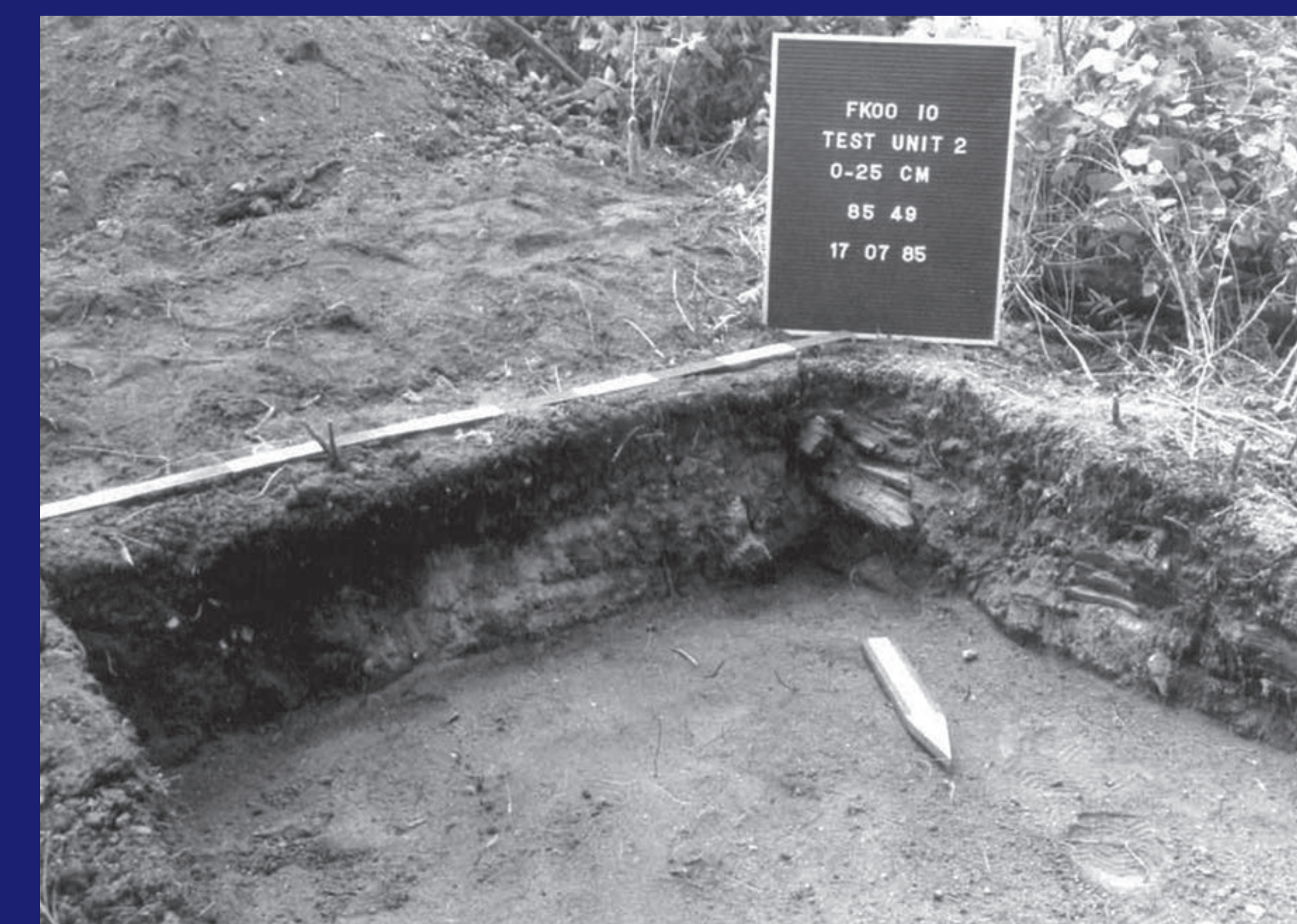
Excavations at Frog Lake Settlement Fouilles dans l'établissement de Frog Lake E-mōnācahikātek Ayiki-Sākahikan wikiwina