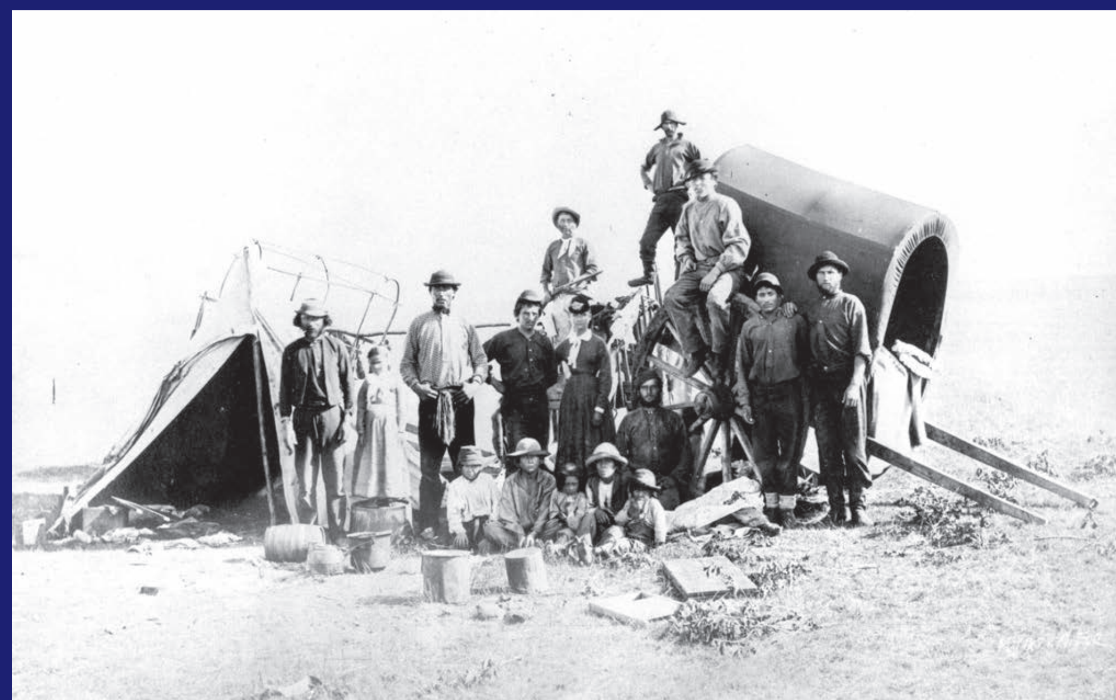
Library and Archives Canada / Bibliothèque et Archives Canada C116