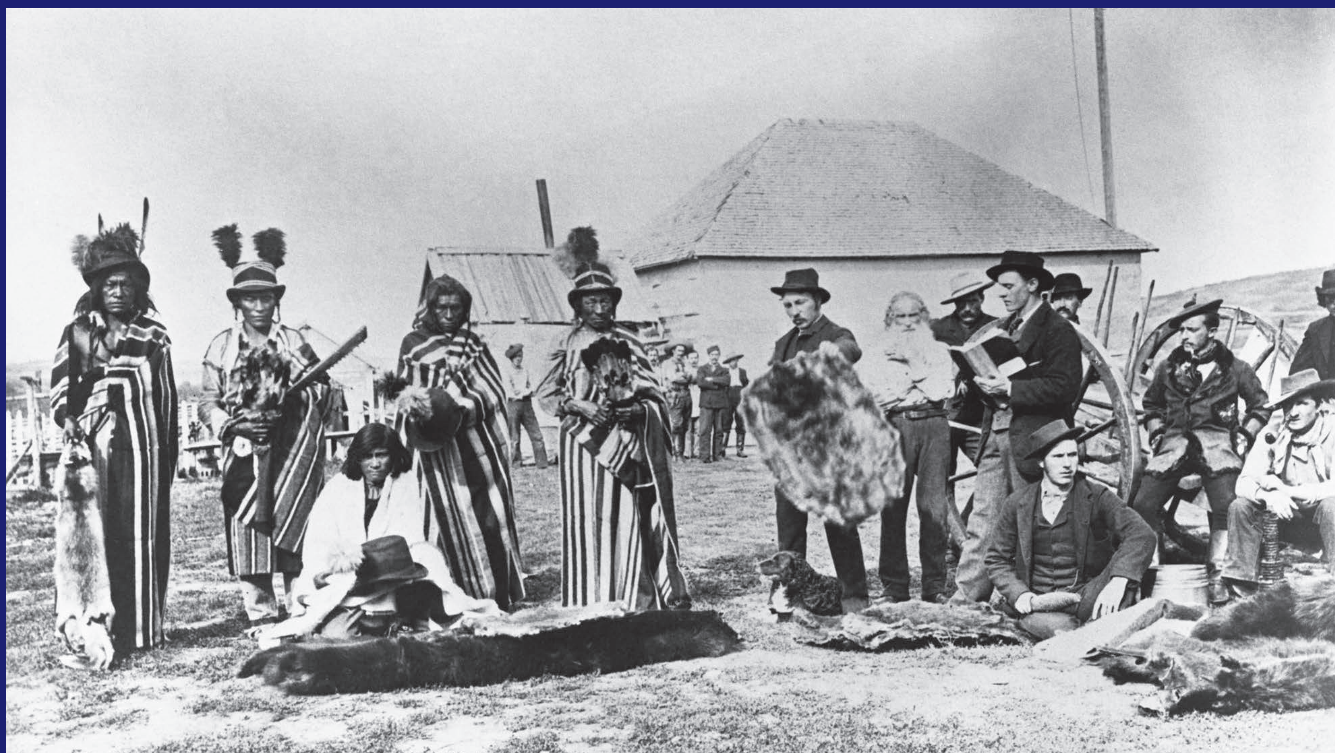
Cree trading at Ft. Pitt 1884, Big Bear 5th from left