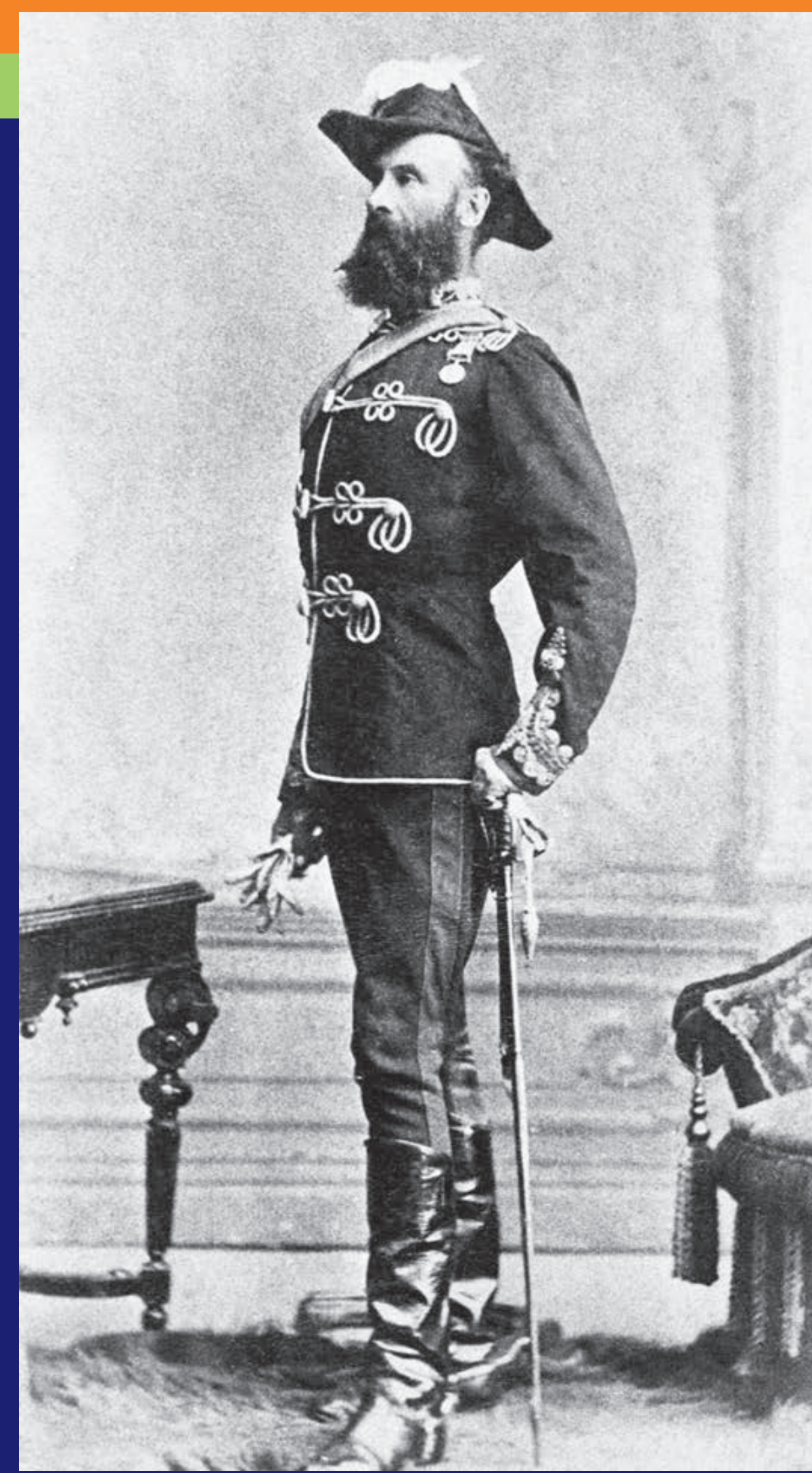
Major-General Thomas Bland Strange, Commander of the Alberta Field Force Major-Général Thomas Bland Strange, Commandant de l'Alberta Field Force Major-General Thomas Bland Strange, simākanisikimāw ohci Alberta Field Force