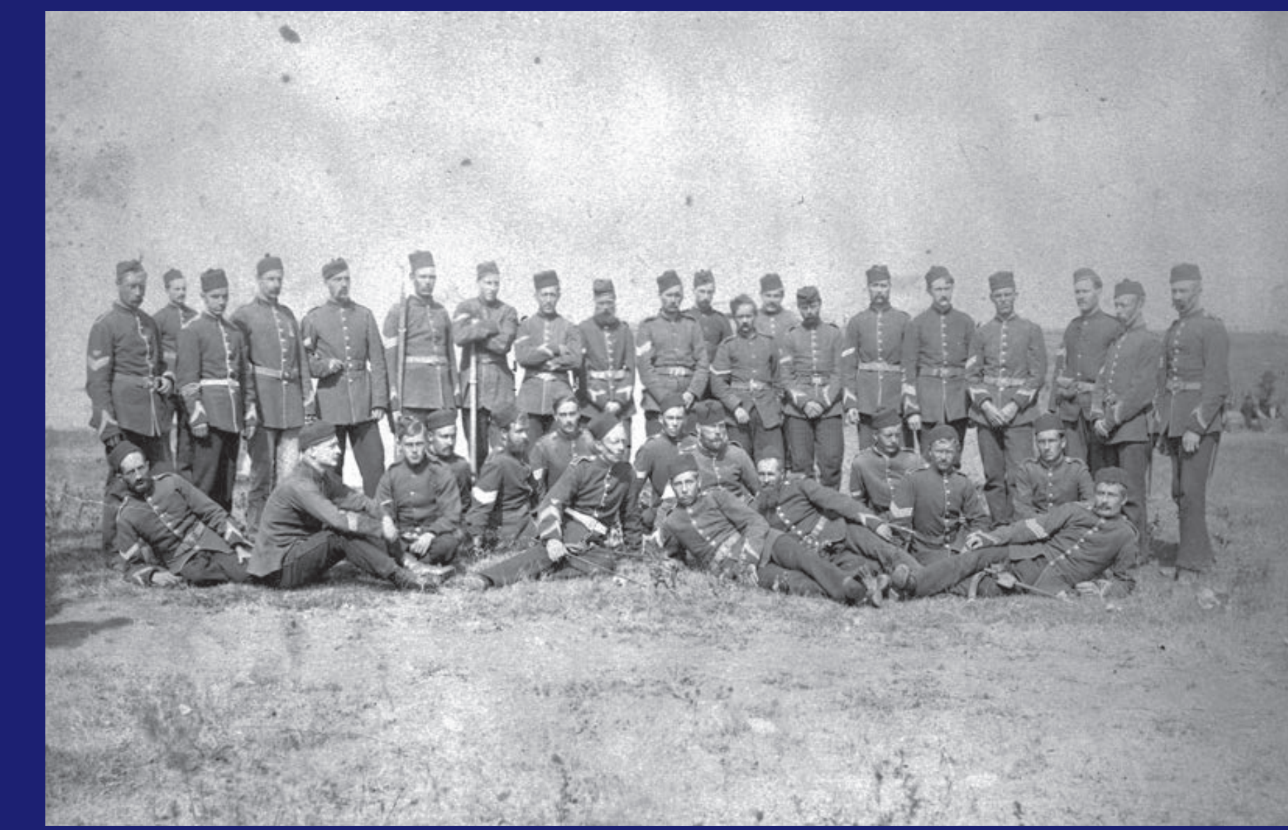
Winnipeg Light Infantry, 1885 Infanterie légère de Winnipeg pendant la Rébellion de 1885 Winnipeg Light Infantry, 1885

P.A. A.1461