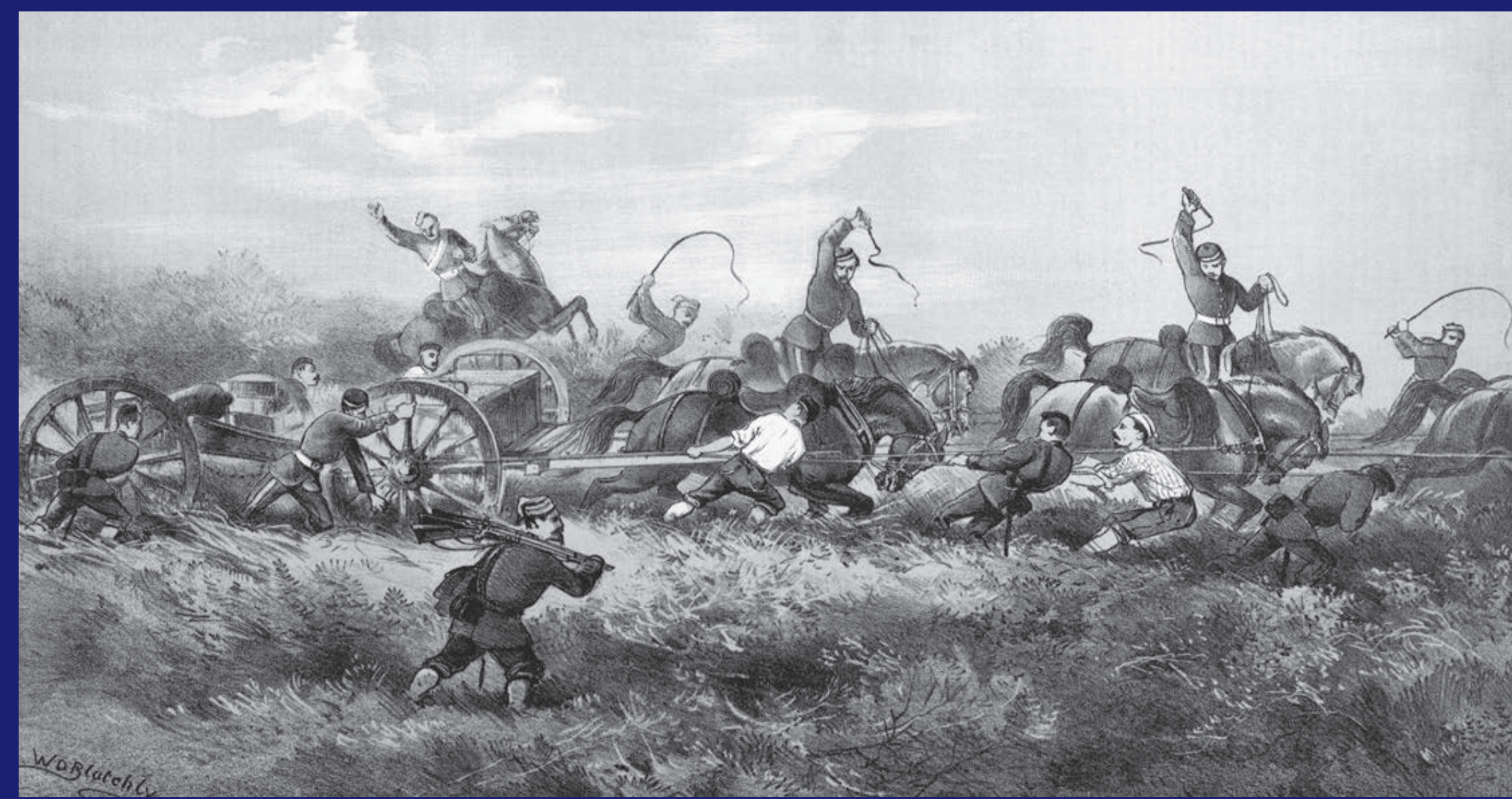
65th Battalion, Mount Royal Rifles in Pursuit of Big Bear, 1885 65ième bataillon, Mount Royal Rifles à la poursuite de Big Bear, 1885 65th Battalion, Mount Royal Rifles enawawecik Mistahi Maskwa, 1885

Après le saccage de Fort Pitt, Wandering Spirit et la bande fuyèrent, à l'est avec leurs prisonniers appartenant aux forces qui les poursuivaient. Après les batailles contre la colonne de Strange à Frenchman's Butte le 28 mai et avec les scouts de Steele à Loon Lake le 3 juin, Big Bear se rendit aux autorités le 2 juillet.