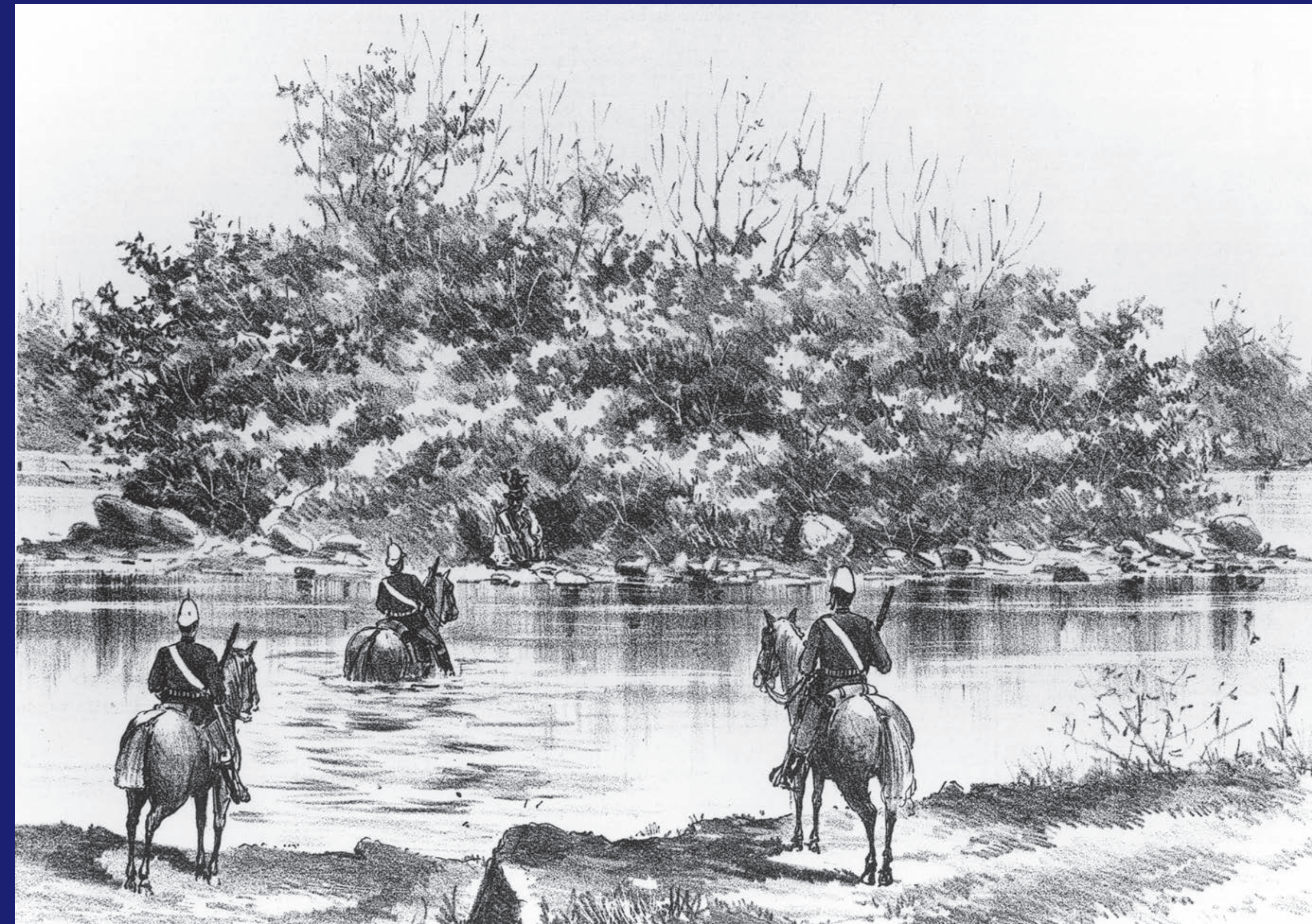
Glenbow Archives MA-1480-38